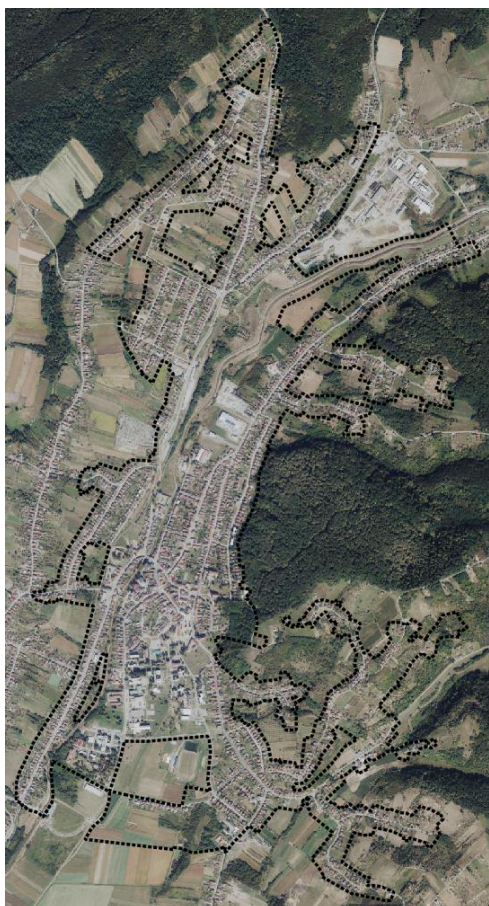
Prikaz 1. Obuhvat UPU preuzet iz ISPU sustava – ePlanovi, Geometrija plana, na DGU podlogama

Obuhvat Urbanističkog plana uređenja grada Pakraca prikazan je u ISPU sustavu ePlanovi-Geometrija plana, a odnosi se na veći dio područja naselja Pakrac, površine cca 351,68 ha.