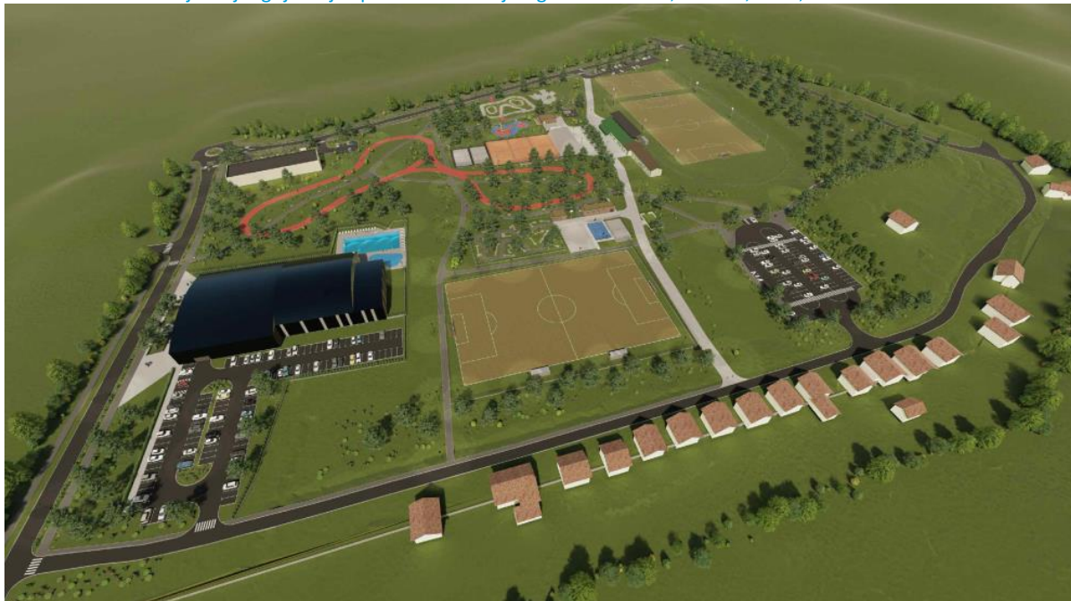
Slika 7: 3D vizualizacija idejnog rješenja Sportsko rekreacijskog centra Pakrac, MPLAN, 2022, Pakrac

Na temelju izrađenog idejnog rješenja, novi sportsko rekreacijski sadržaji u građevinskom području sportsko- rekreacijske zone Pakrac definirat će se kroz ovaj UPU a kasnije i projektnu dokumentaciju za građevine sportsko rekreacijske namjene koje će biti na korištenju svim stanovnicima Grada Pakrac.