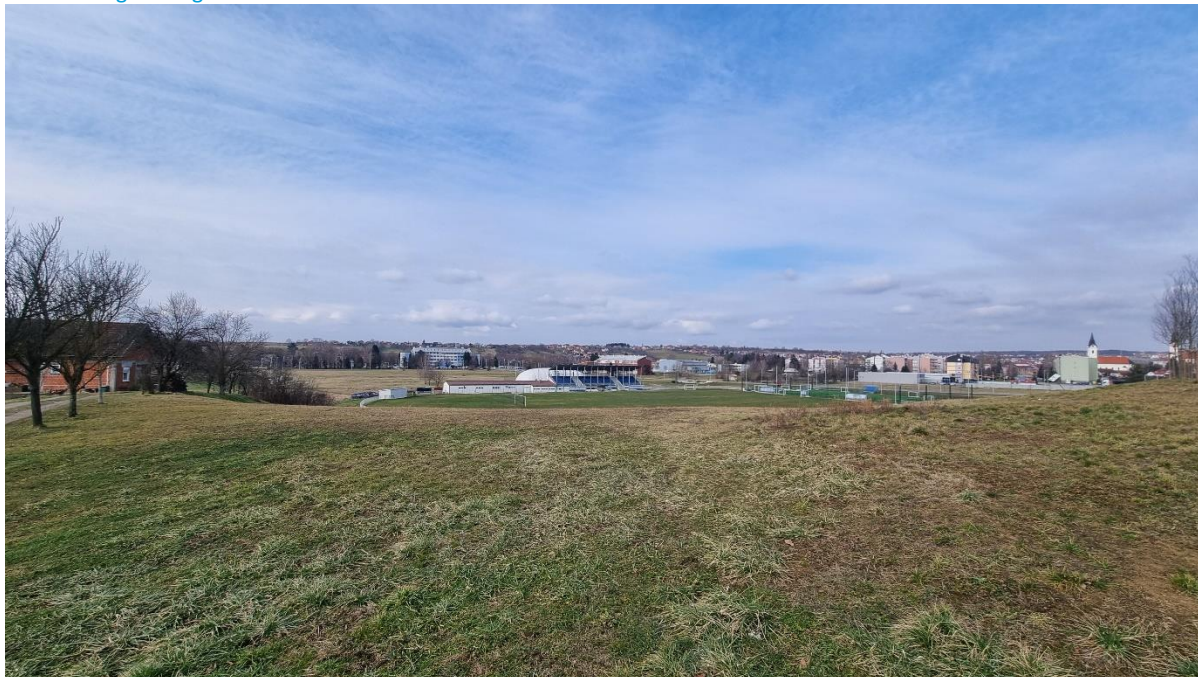
Slika 12: Pogled na gradski stadion