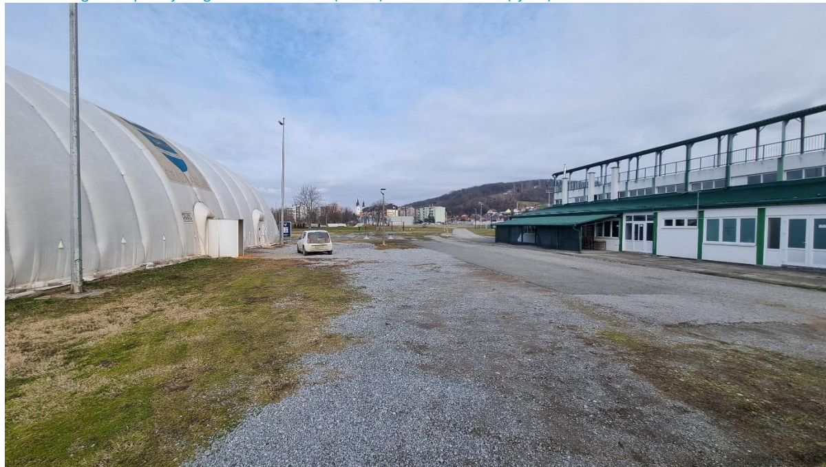
Slika 13: Pogled na postojeću građevinu- stadion (desno) i natkriveni teren (lijevo)

parkiralištu unutar obuhvata Plana. Iznimno čestice na kojima se grade isključivo sportski tereni, dječja igrališta, skate park ili sl. ne moraju imati pristup na javnu prometnicu, već se pristup može osigurati preko pješačke površine te nije potrebno da imaju priključak na svu komunalnu infrastrukturu.