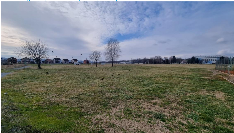
Slika 14: Pogled na površine na kojima se planira sport na otvorenom

Svaka građevna čestica mora imati pristup na javnu prometnicu te priključak na komunalnu infrastrukturu, u skladu s uvjetima ovog Plana. Propisani broj parkirališnih mjesta u zoni R3 osigurava se na javnim parkiralištima unutar obuhvata Plana. Čestice na kojima se grade isključivo sportski tereni, dječja igrališta, skate park ili sl. ne moraju imati pristup na javnu prometnicu, već se pristup može osigurati preko pješačke površine te nije potrebno da imaju priključak na svu komunalnu infrastrukturu.