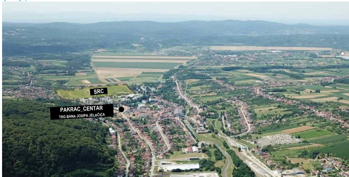
Slika 2: Položaj sportsko rekreacijskog centra u odnosu na javne građevine u centralnom djelu Pakraca

Prostor unutar obuhvata UPU SRC Pakrac je od izrade GUP-a Grada Pakraca 2001. godine planiran i rezerviran za sportsko-rekreacijsku namjenu u naselju. Prostor SRC-a u dijelu se koristi kao nogometni stadion te je planiranje ostalih sportskih i rekreacijskih građevina na tom području logički nastavak planiranih aktivnosti. U blizini SRC Pakrac nalaze se osnovna i srednja škola te je gradski centar udaljen nekoliko kilometara. Slijedom navedenog, definiranjem i građenjem novih sportskih i rekreacijskih sadržaja u naselju omogućiti će stvaranje boljeg životnog standarda stanovnika Grada Pakraca.