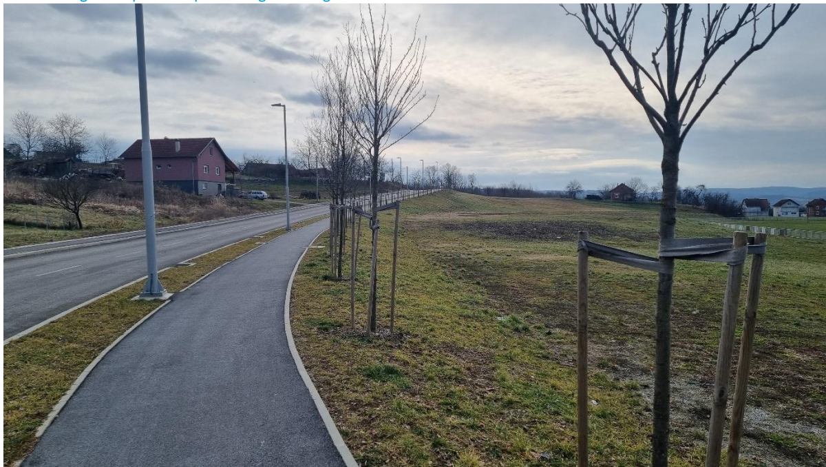
Slika 10: Pogled na površinu planiranog zaštitnog zelenila

Zaštitne zelene površine (ZZ) planirane su na dvije lokacije: