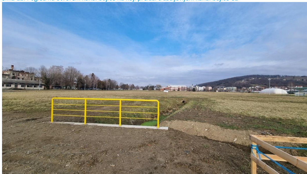
Slika 11: Pogled na otvoreni kanal bujice K1 koji prelazi u zacijevljeni kanal bujice C1

Ovim Planom kao građevine zaštite od štetnog djelovanja voda planira se: