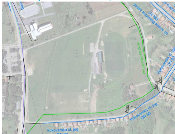
Slika 4: Stanje infrastrukture vodoopskrbe