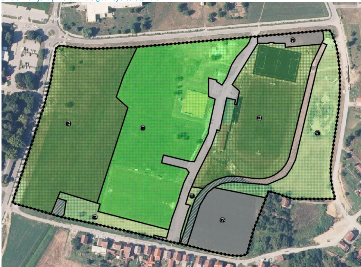
Slika 9: Namjena prikazana na digitalnoj ortofoto karti

Na površinama sportsko-rekreacijskih građevina (R2) predviđa se gradnja građevina za potrebe sporta i rekreacije u zatvorenim prostorima (sportske višenamjenske dvorane, tereni, otvoreni i zatvoreni bazeni, bazenske dvorane, teretane i fitness centri, kuglane, streljane i sl.) i sportsko rekreacijskog nogometnog centra a uz koje je moguće planirati i različite pomoćne i prateće sadržaje u funkciji sporta (klupske prostorije, garderobe sanitarije, tribine, manji ugostiteljski sadržaji i sl.). Uz osnovnu namjenu dozvoljena je prateća javna, društvena, poslovna i/ili ugostiteljska namjena (ugostiteljske, uslužne, trgovačke, servisne i sl.).