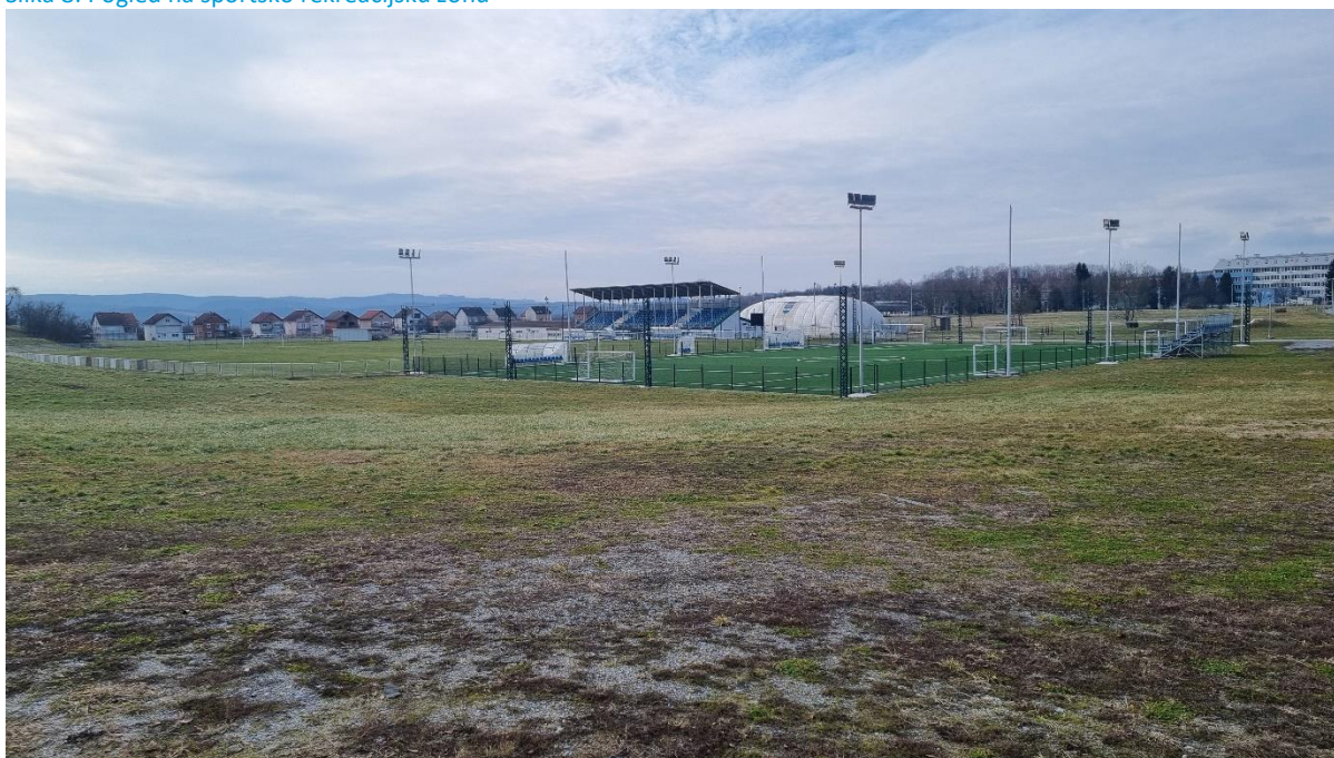
Slika 8: Pogled na sportsko rekreacijsku zonu

Temeljni programski zahtjevi za izradu UPU SRC Pakrac utvrđeni su Odlukom o izradi i odnose se prvenstveno na cjelovito uređenje prostora i njegovo opremanje pratećim sadržajima, prometnom, komunalnom i drugom infrastrukturom u skladu s programskim odrednicama koje su utvrđene PPUG-om Pakraca i idejnim rješenjem.