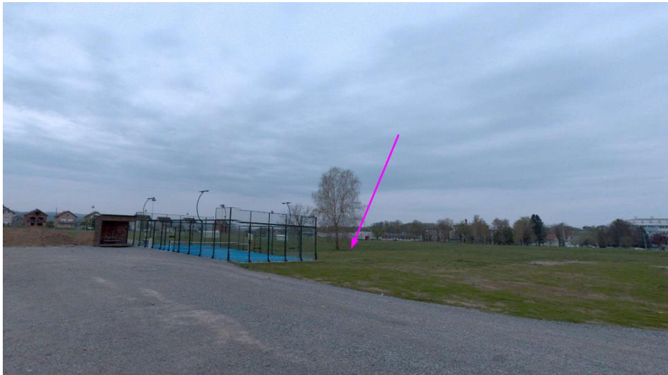
Slika 1. Postojeće stanje